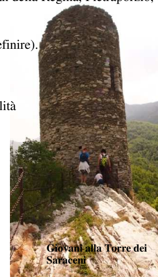
Giovani alla Torre dei Saraceni