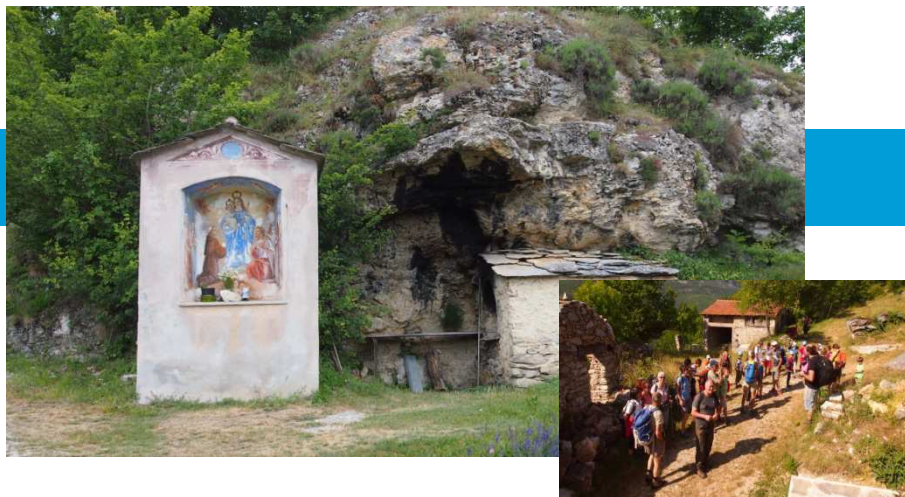
Con i giovani da Eca ad Albra

Gli accompagnatori della sezione organizzeranno: 1) nel periodo estivo escursioni più impegnative nelle vallate del cuneese; 2) Al martedì e giovedì sera camminate notturne con partenza dal “ ponte del Tanaro ” di Garessio Ponte.