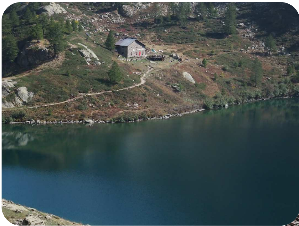
Colle del Chiapous: verso il passo del Porco